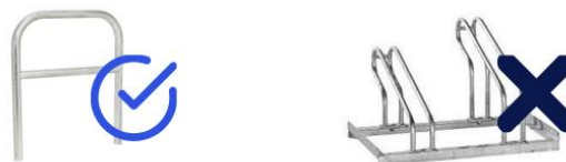
Figure 3. Arceau vélo U renversé versus pince-roues (FUB et ROZO, 2019)

Les interventions sur l'existant présentent un avantage financier : dans le programme ALVEOLE 2, la pose d'un stationnement pour vélo dans un local existant d'un bailleur social coûtait environ 110 euros 18 par place dédiée pour un vélo (avec des coûts cependant assez variables d'un territoire à l'autre, en fonction du choix des arceaux, etc.). Un coût attractif et une première étape utile pour sécuriser la pratique du vélo dans les résidences sociales. Inscrites dans le cahier des charges du programme ALVEOLE , la sécurisation des stationnements (type d'attache, accès, lumière), la pertinence de leur localisation et leur facilité d'accès sont des facteurs déterminants à l'usage quotidien du vélo par les résidents. D'après les bailleurs Valophis et l'Office Public d'Aménagement et de Construction (OPAC) Saône-et-Loire 19 , de nombreux usagers et usagères insistent pour avoir accès à des consignes individuelles sécurisées et restent méfiants face aux locaux collectifs. Pour certains bailleurs, la mise en place de consignes individuelles est devenue impérative avec l'arrivée de nouveaux types de vélo au coût relativement élevé, comme les vélos à assistance électrique ou les vélos cargos. Cette sécurisation a néanmoins un coût : un emplacement atteindrait en moyenne 1 300 euros 20 .